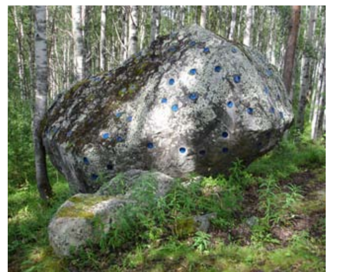
VUASSILAN KIVI ON VUONNISEN PIÄNÄHTÄVYYŠ.

– Kylän laitah kun mänimä, ni kylä jo palo. Ämmöt ta kaikki itkuh, jotta avoi voi kylä palau. Šemmoni oli poliitiikka šiieh aikah. Kommunistit annettih käšyn, jotta pitäy kylä polttua, jotta ei jäis vihollisilla. Kaikki laitokset, kirjašto, koulu, klupi ta paremmat talot