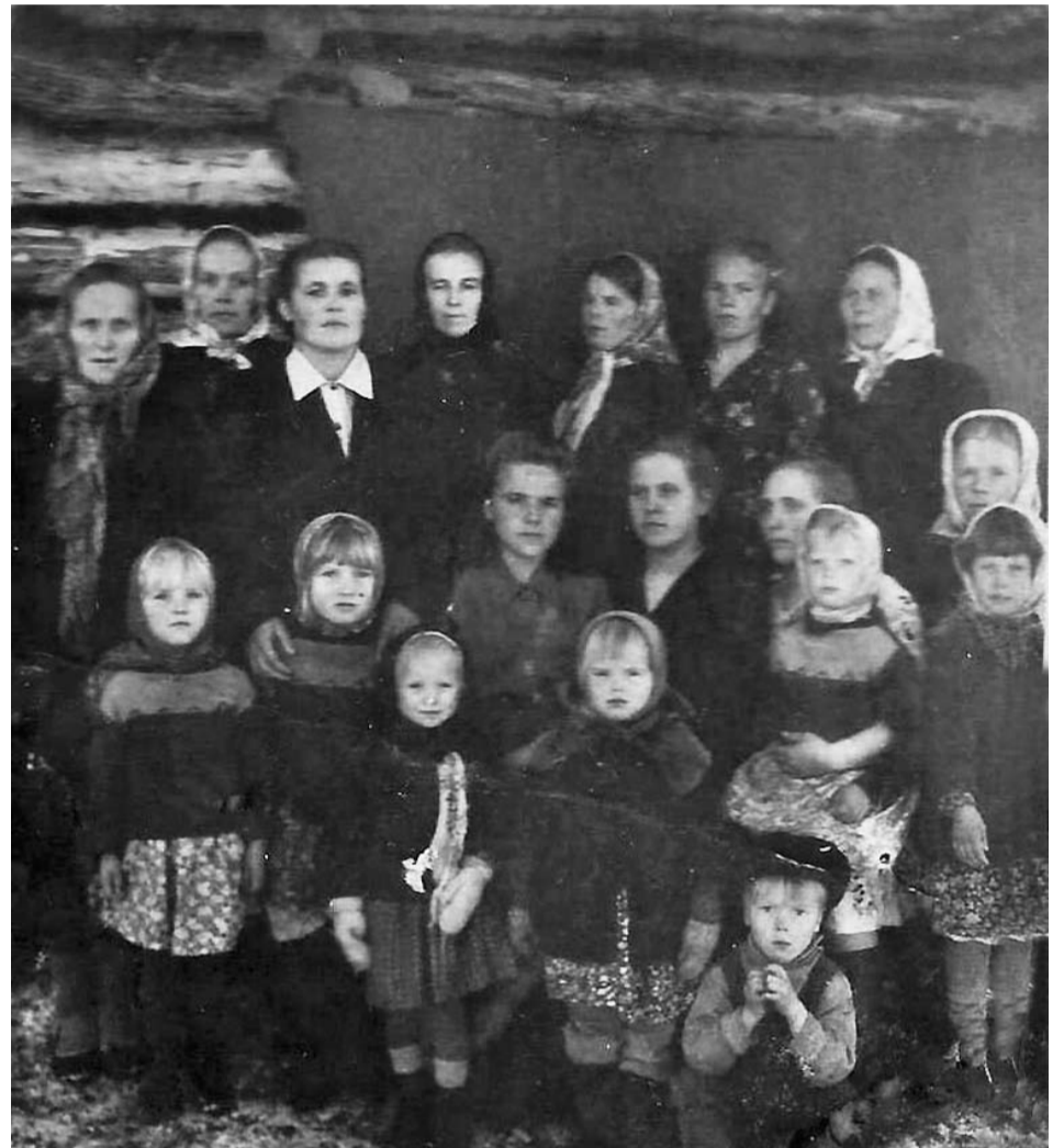
RUOKOŠALMEN LESOPUNKTIN ELÄJIE. KUVA OTETTU VUOTENA 1955