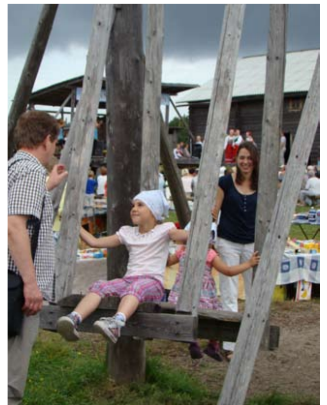
HUVIJA RIITTI LAPŠILLA TA AIKUIHILLA.

Koko pruasniekkapäivä pakšut pilvet kierreltüh kylän yllä, onnako yhtänä vesipisarua ei tippun taivalhalta Kinnermäjen mualla. Pruasniekkaohjelma oli loppumaisillah ta ikäh kuin šen kulminaatijona, alko šaje ta šamanaikasešti pakšun pilven takuata näyttäyty päiväni. Ikäh kuin taivaš laško šiu naukšeh Kinnermäjellä ta anto merkin šiitä, jotta tämä kylä eläy vielä monie vuosie.