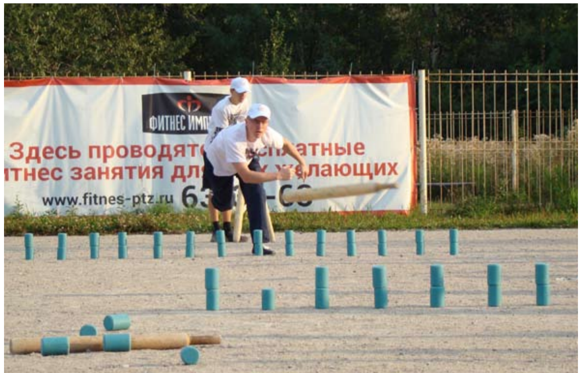
KILPAILUN AIKANA INTO YHÄ KAŠVO.

- Muissan, jotta lapšena ollešša pelasima melkein šamanlaista pelie. Tämä oli tovela mukavua kokemušta varšinki työnetälin jäl-