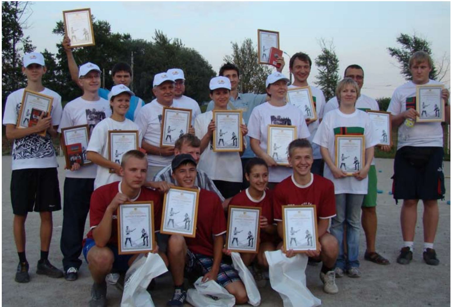
KAIKKI KILPAILUAT ŠUATIH OŠALLISTUJIIEN DIPLOMIT TA LAHJAT PIVON JÄRJEŠTÄJILTÄ.

Kilpailumateriaija otetah vaštah 10.šyyškuuta šuate.