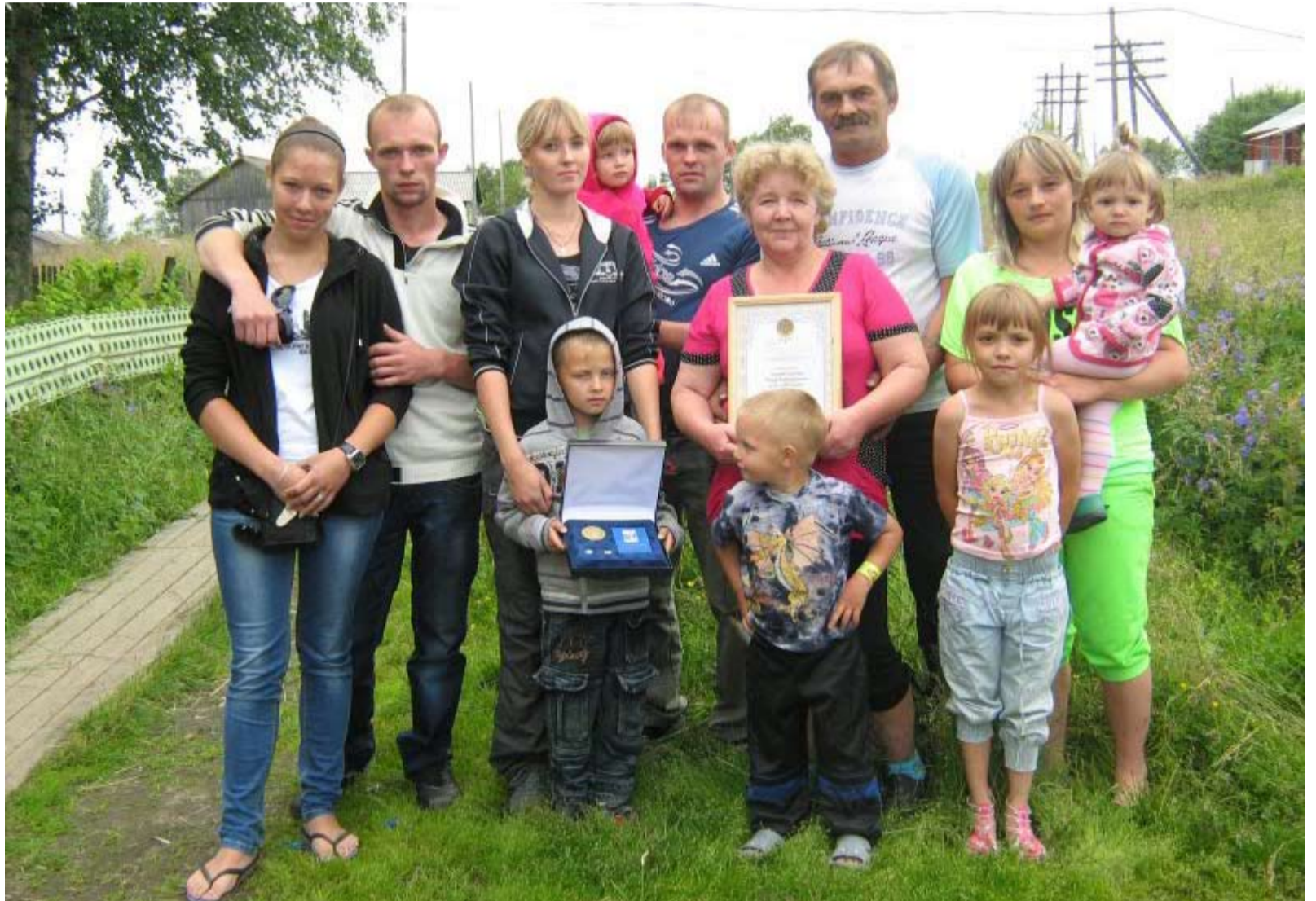
NYT, KONŠA YŠTÄVÄLLINI SAVČENKON PEREH KERÄYTY YHTEH, HEITÄ ON 19 HENKIE.

Pruasniekan uattona pereh lopetti heinätyöt, nyt ämmön kahella lehmällä riittä yheššä uutah kešäh