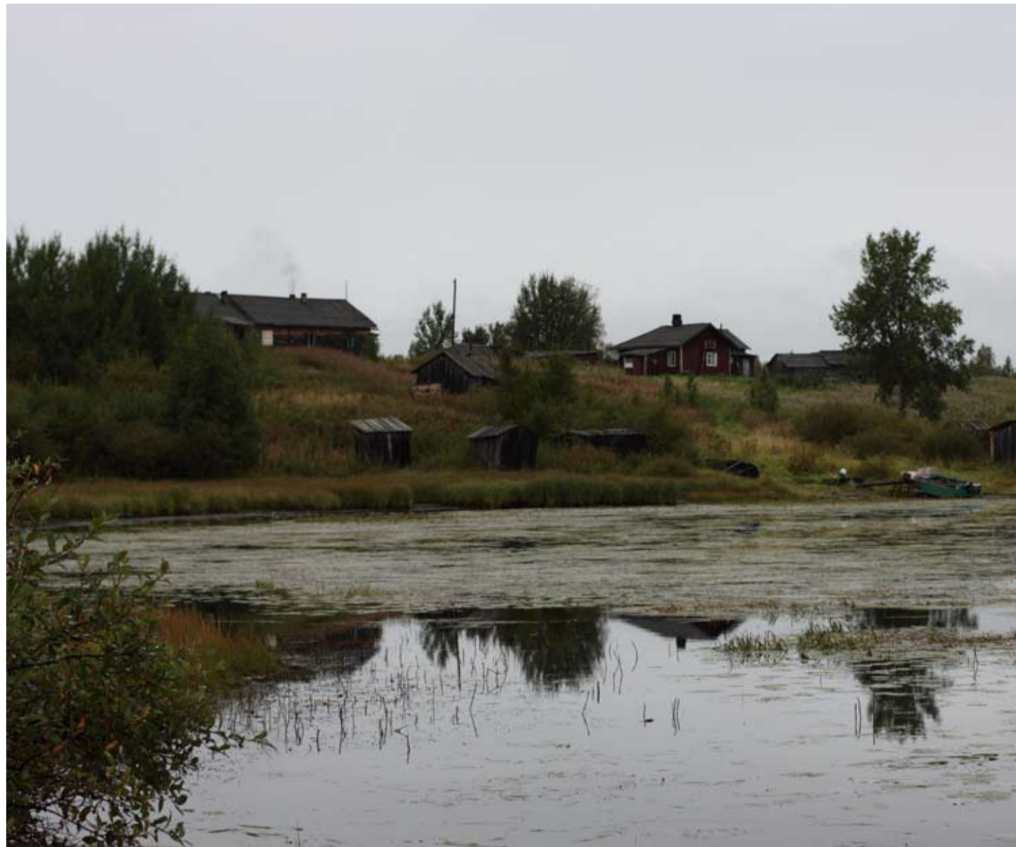
POHJOISLUONNON KAUNEUŠ TA KYLÄNELÄMÄN RAUHA MUANITETAH TURISTIJA.

– Hermoššutti kovašti, kun suomalaisetki šanottih, jotta Vuonnisešša ei ole ollun taloja eikä ole ollun ihmisie.