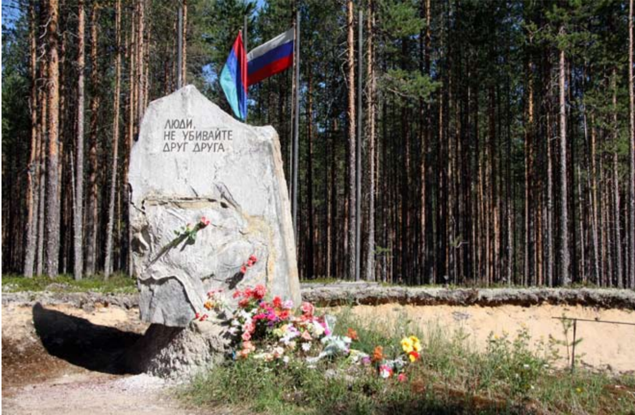
PETROSKOILAISEN KUVANVEŠTÄJÄN GRIGORI SALTUPIN LUAJITUŠŠA GRANITTIMEMORIAALISSA ON KIRJUTETTU: "IHMISET, ELKYÄ TAPPAKUA TOINI TOISTANA".