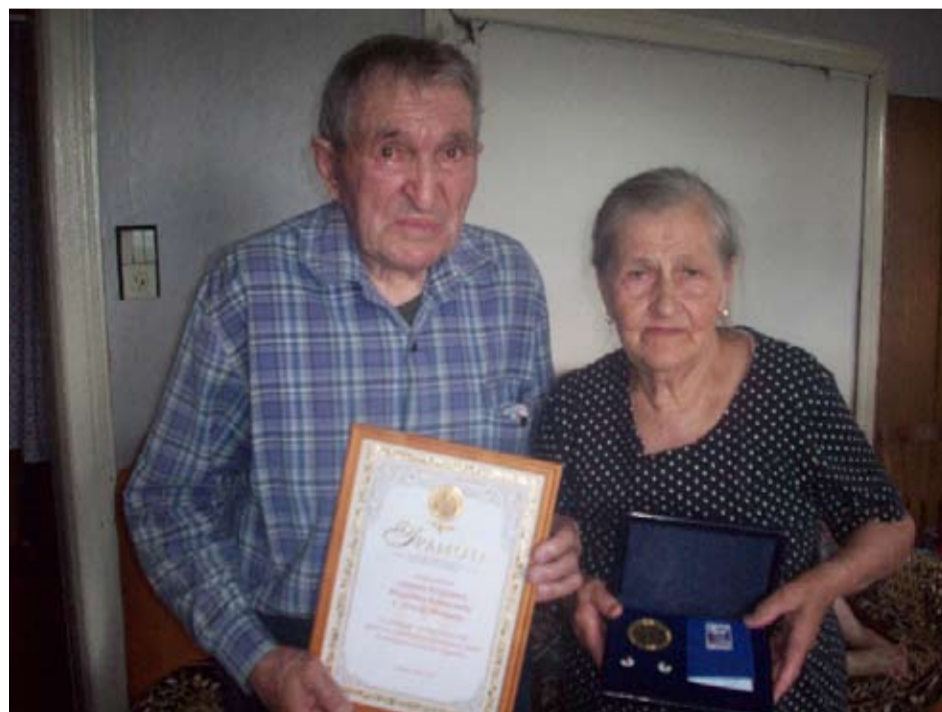
VIIME VUOTENA RAKKAHUOŠTA TA UŠKOLLISUUVVEŠTA -MITALI OLI MYÖNNETTY ISKAKOVIEH PEREHELLÄ.

Perehen kolme tytärtä eletäh loittuona vanhemilta: kakši eläy Piiterissä,