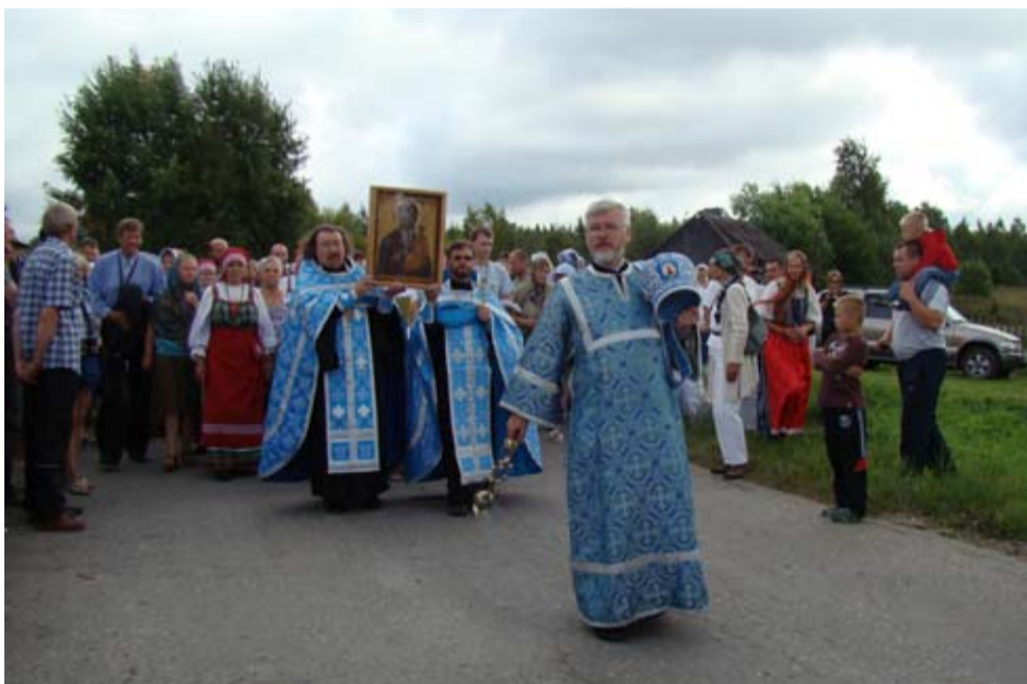
RISSINŠUATON VÄKI KIERTI KYLÄ. NÄIN KINNERMÄJEN YMPÄRISTÖT ŠUATIH ŠIUNAUŠEN SMOLENSKIN HODIGITRIA JUMALANMUAMOLTA.

hentamiseh ta hiršisien palokaivojen rakentamsieh. Avuštajista ei ole ollun puutehta. Harmittau ta šamalla ihmetyttäy vain še, jotta apuo ta tukie tulou enemän rajan takuata eikä kotimuašta.