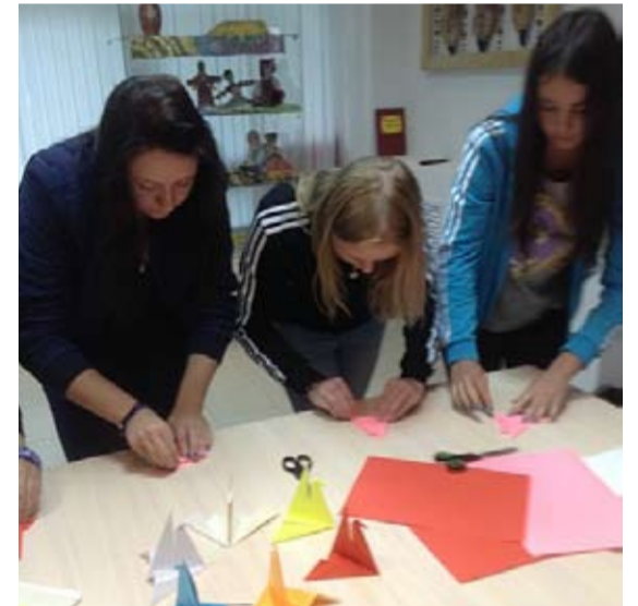
KARJALAN KULTTUURIKOLLEDŽIN OPAŠTUJAT TA OPAŠTAJAT OŠALLISUTTIH AKTIJON TERRORIE VAŠTAH TA LUAJITTIH KURKUA PAPERISTA.

Petroskoin monissa kešikouluissa piettih Muisson tuntija. Tašavallan patriottien kašvatukšen keškukšen jäsenet kerrottih koululaisilla ta heijän opaštajilla omašta työšta, näyttetih Al'fa- ta Vimpel -erikoisyksiköillä omissettuja filmijä. Kaupunkin Klučevaja-ošašša järješsetih Muisson tuohuš -konsertti. Šen lisäksi piettih Karjalan lapšet Beslanin lapšilla -aktijo, kumpasiešša karjalaiset lapšet ta heijän vanhemmat kirjutetih kirjasie ta piirušsetih kuvie, kumpasie lähetetih Pohjois-Osetijah.