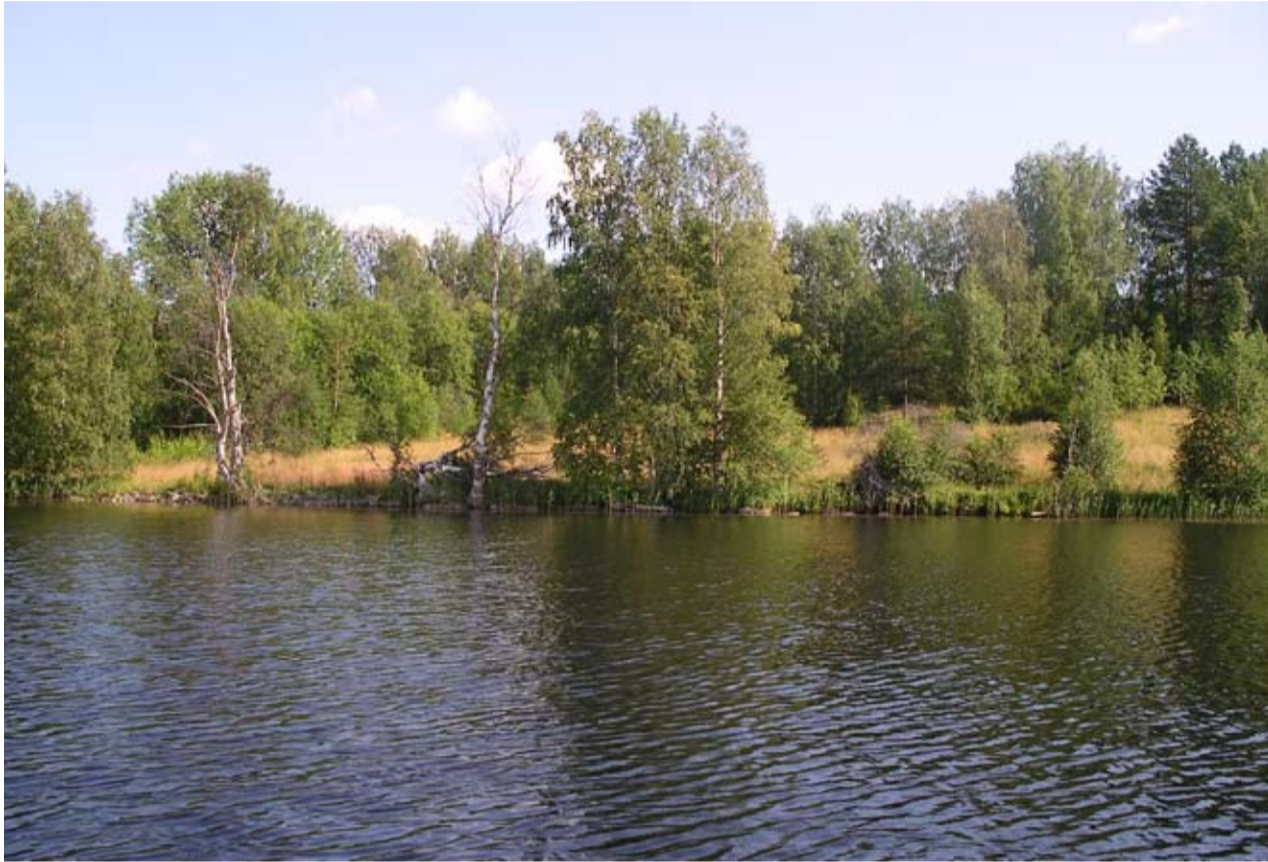
HIISJÄRVEN KYLÄ JO VUOSIKYMMENIE EI OLE KARTOILLA.

Vuotena 1811 Hiisjärvelä oli nellä taluo: kolme Jelsejevien taluo ta yksi Sofont-