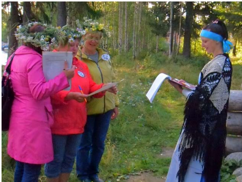
LEIKIN KUULU, LAULU -KILPAILUN AIKANA.

Pruasniekan ošallistujien mielešta, šemmoset toimeh-pivot autetah karjalan kielen ta kulttuurin šäilyttämistä ta kehittämistä.