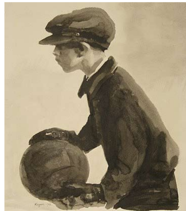
TERVEHEŠŠÄ VARTALOŠŠA ON TERVEH ŠIELU -NÄYTTELYN A.F. KOZLOVIN MUALIVAHTI-KUVA, 1962 V.

Aktijon ta näyttelyn järještäjät toivotah, jotta šemmoset tapahtumat autetah urheilun popularisointie Venäjällä.