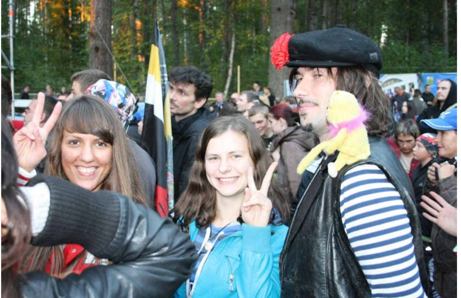
FESTIVAALIH AINA KERÄYTY ÄIJÄN RAHVAŠTA, ELÄVÄN MUSIIKIN HARRAŠTAJIE.

Vuuvvešta vuoteh festivaali kehitty ta kaččojien määrä kašvo. Vuotena 2007 Vozduh-festivaalih tuli jo yli 30 tuhatta kaččojua. Festivaalin puittehisša jo kakši vuotta peräkkäh toimi Mukava Vozduh -ohjelma, kumpani anto mahollisuuvven vammaisihmiesienki ošallistuo festivaalih. Liikuntarajotetuilla ihmisil-