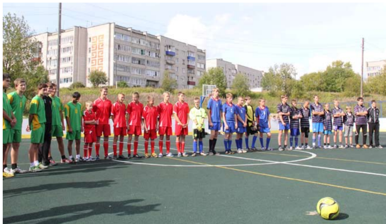
MINI-JALKAPALLON KILPAILUN OŠALLISTUJAT. KUVA OTETTU GOV.KARELIA.RU -NETTIŠIVUILTA.