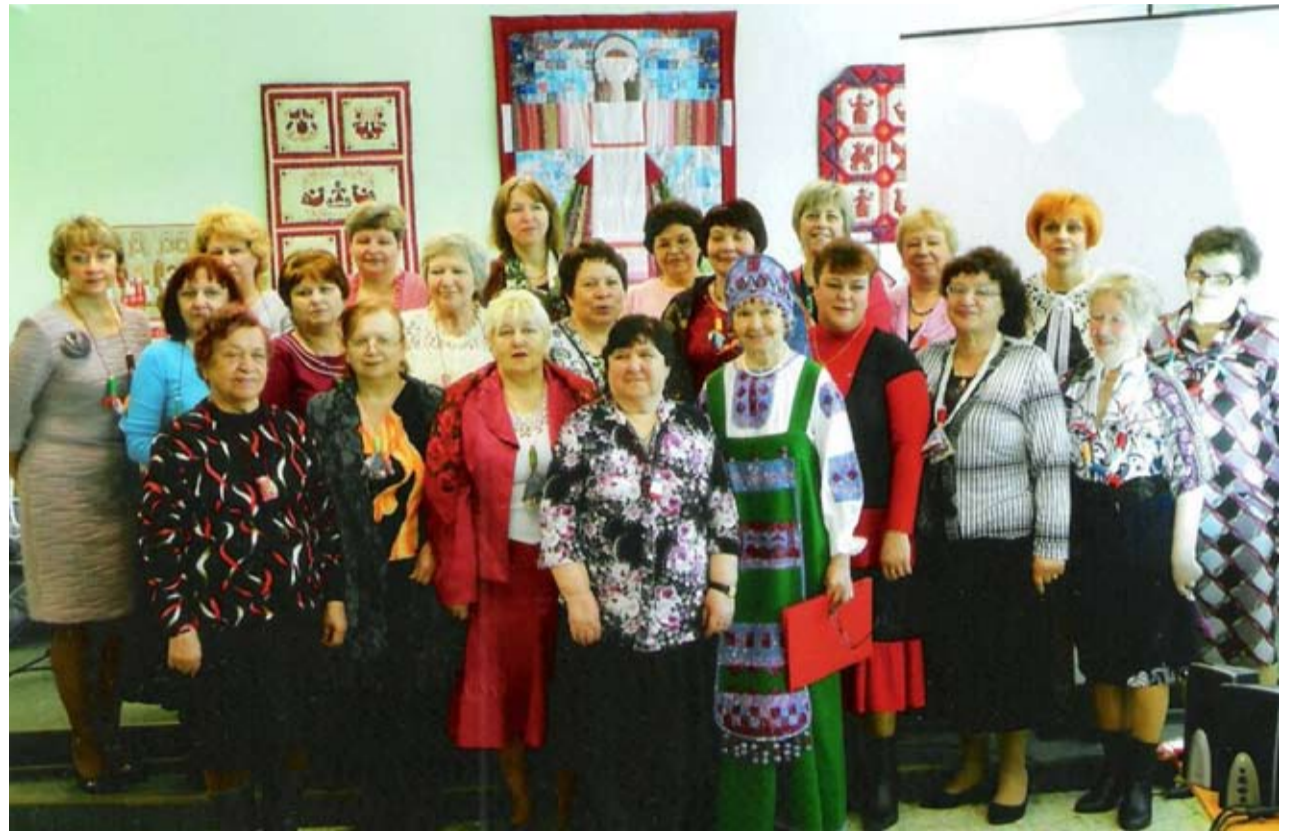
KEMIN NAISIEN L'APAČIHA-KLUBISSA HARJOTELLAH ERI-İKÄSET KÄSITYÖMUASTERIT.

→ Adressi: Leninin aukijo, 1 → Telefoni: 76-94-79