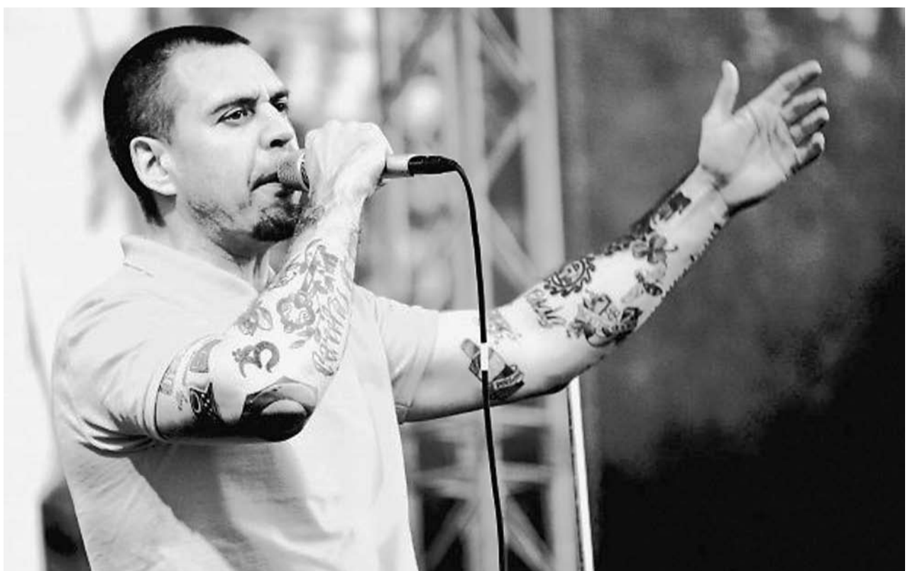
TÄNÄ VUOTENA FESTIVAALIN PÄIŠOITAJIEN LUVETTELOŠŠA OLI TUNNETTU MUSIIKKO VALKOVENÄJÄLTÄ LÄPIS TRUBETSKOI.

Myö pitälti šitä vuottima ta tänä vuotena Vozduh. Perezagruzka -festivaali piettih 6.–8. šyyškuuta Petroskoin lähellä Aviaretromajapaikašša.