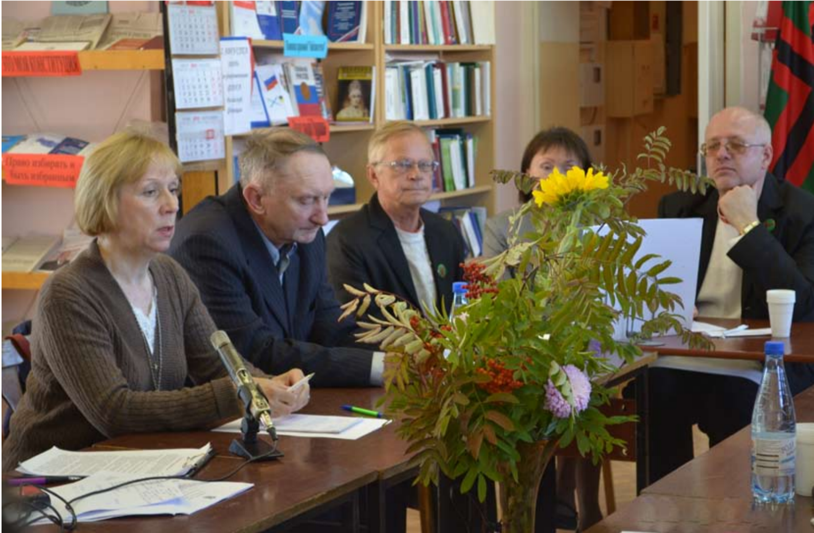
FESTIVALIN AIGAH PIETTIIH PYÖRYŽY STOLA, KUDAMAN AIGAH PAISTIH KARJALAN KIELEN DA KARJALAZEN KULTTUURAN VUVVES.

Festivuali: Anuksenlinnas Vladimir Brendojevan roindupiän, 6. syvyskuudu, piettih jogavuodine Täs synnyinrannan minun algu -nimine festivuali.