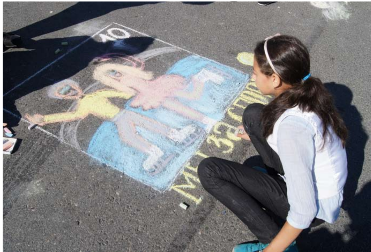
LAPŠET OŠALLISSUTTIH URHEILU, ŠIE OLET MUAJILMA -KILPAILUH TA PIIRUŠŠETTIH ASFALTILLA.

Urheilu: Venäjällä starttasi aktijo, kumpani auttau urheilun popularisointie.